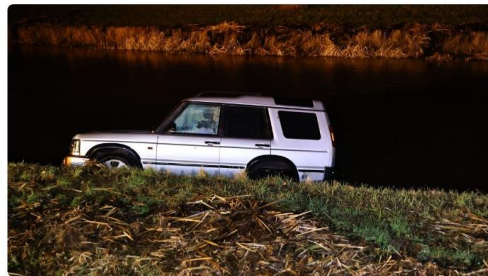
De auto belandde in een kanaal aan de Bronnegerstraat

Tussen Buinen en Bronneger is vanavond een auto te water geraakt. De bestuurder van de auto is in de ambulance overgebracht naar het