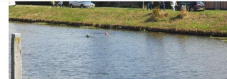
Hulpdiensten bij het Stieltjeskanaal

Voorpagina Nieuws Drenthe Kiest Sport Kijk Luister Weer