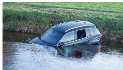
De auto belandde in het water bij de Wijk