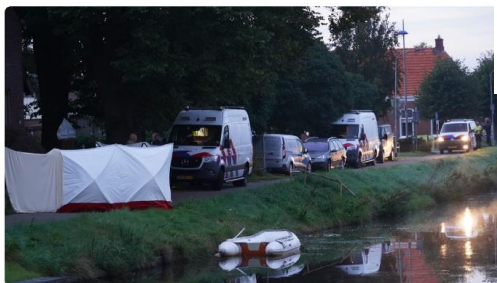
Hulpdiensten rukten massaal uit nadat iemand in het water werd gevonden